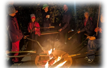
Stockbrot am Reformationstag . Eine gelungene Primäre