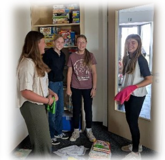
Großputz 2025 . Mit vielen fleißigen Helfern haben wir das Gemeinschaftshaus geputzt, auch das musste sein :-)