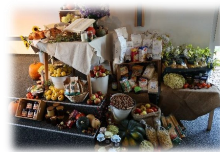
Im Oktober feierten wir gemeinsam Erntedank . Mit dem schön geschmücktem Gabentisch und

Ecuador liegt an der Nord-Westen-Küste Südamerikas und war eine Spanische Kolonie, weshalb die Amtssprache auch Spanisch ist. In der Kolonialzeit wurde den einheimischen der katholische Glaube aufgezwungen, was sich dann mit animistischen Elementen vermischt hat. Heute sind die Leute dort offen für religiöses und suchen darin auch meist die Antworten auf ihre Lebensfragen. Jesus und das Evangelium ist den meisten aber nicht bekannt und so suchen sie die Lösungen in anderen spirituellen Ansätzen.